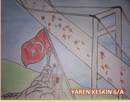
YAREN KESKİN 6/A