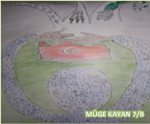
MÜGE KAYAN 7/B